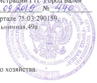
Схема местоположения границ земельного участка, в кадастровом квартале 75:03:290159, расположенного : Забайкальский край, Балейский район, г.Балей, ул.Больничная,49а Площадь образуемого земельного участка равна: 675 кв.м.

"Утверждена" постановлением администрации ГП "Город Балей" от 20.09.2019 № 440